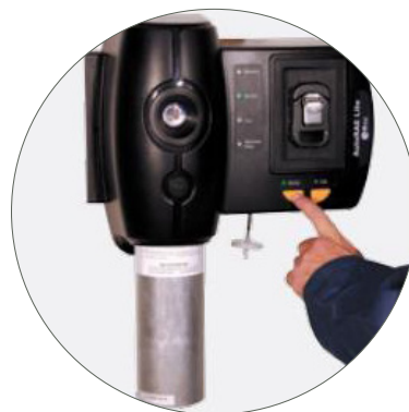
Teste de resposta sendo realizado no ToxiRAE 3 na Estação de Calibração e de teste de resposta AutoRAE Lite