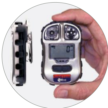
Tamanho pequeno e prático