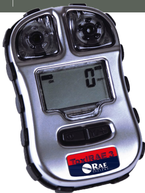
Imagem em tamanho real

• Respostas de emergência • Meio-ambiente • Combate a incêndio • Segurança Industrial • Petróleo e gás